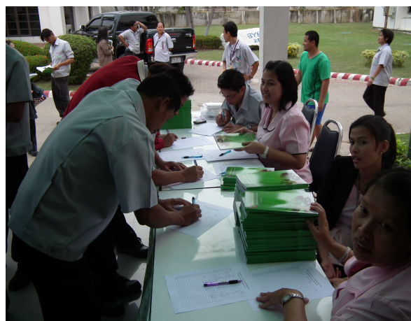
สมาชิกลงทะเบียนเข้าร่วมการประชุมใหญ่สามัญ ประจำปี 2554

สำหรับข้อเสนอของสมาชิกในที่ประชุมใหญ่ที่เสนอให้สหกรณ์ฯ ขยายระยะทางในการรับจ้างองหลักทรัพย์เพื่อเป็นหลักประกันเงินกู้พิเศษนั้น ที่ประชุมคณะกรรมการสหกรณ์ฯ ชุดที่ 30 ครั้งที่ 2 เมื่อวันที่ 8 กุมภาพันธ์ 2555 ได้มีมติเห็นชอบตามข้อเสนอของสมาชิกในที่ประชุมใหญ่แล้ว กล่าวคือ มีมติให้เปิดรับจ้างองหลักทรัพย์เพื่อเป็นหลักประกันเงินกู้พิเศษทั่วประเทศ และจะได้นำมาพิจารณาในการรับจ้างองหลักทรัพย์เพื่อประกาศให้สมาชิกทราบต่อไป