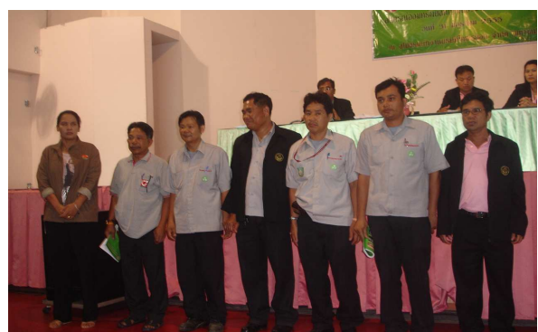
กรรมการฯ ที่ได้รับการเลือกตั้งใหม่